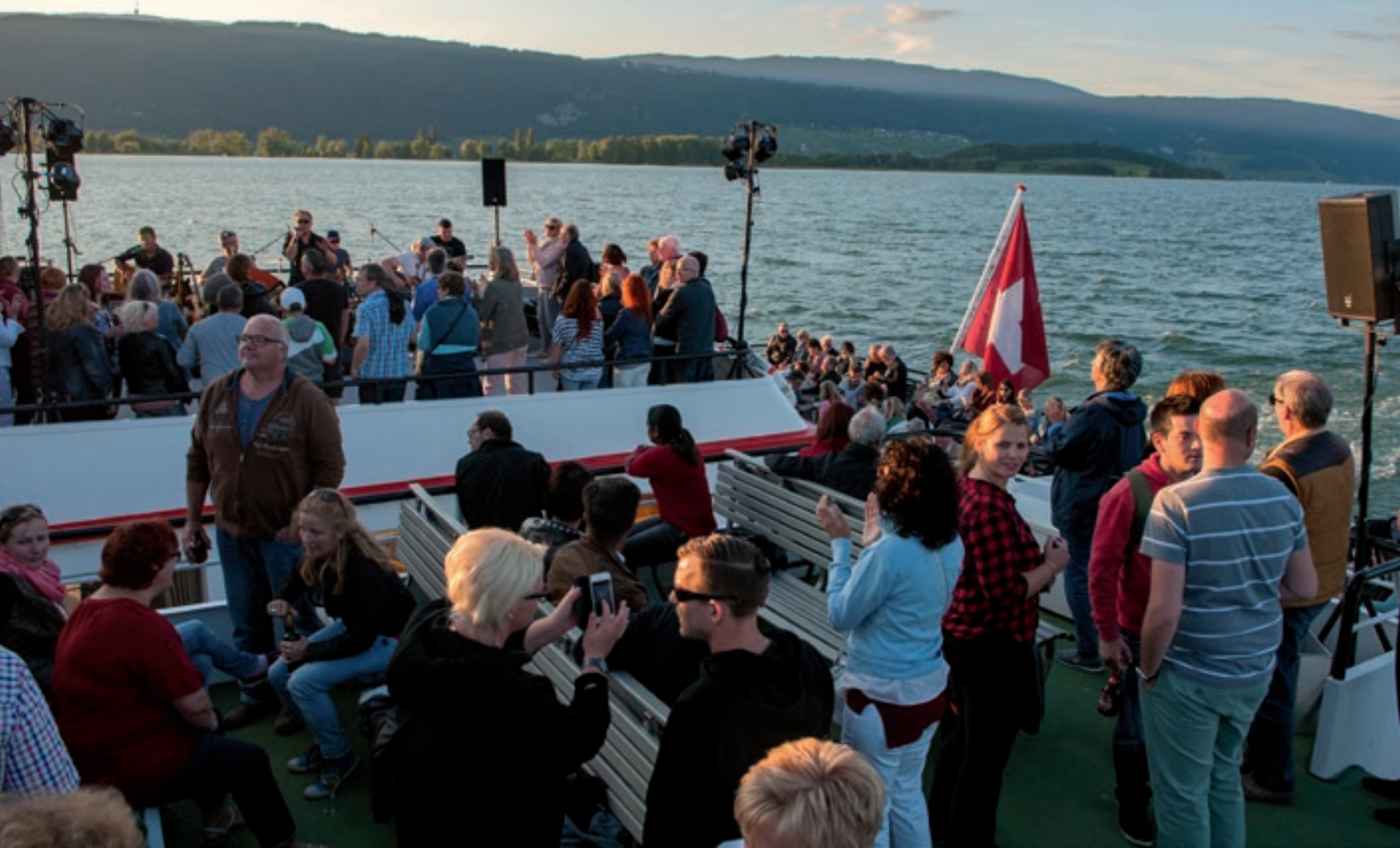
1. SeeSound-Festival auf der MS Petersinsel und MS Berna (zusammengebunden)

Dieses Bild erreichte den 1. Rang des Fotowettbewerbs (Gottfried Balmer)