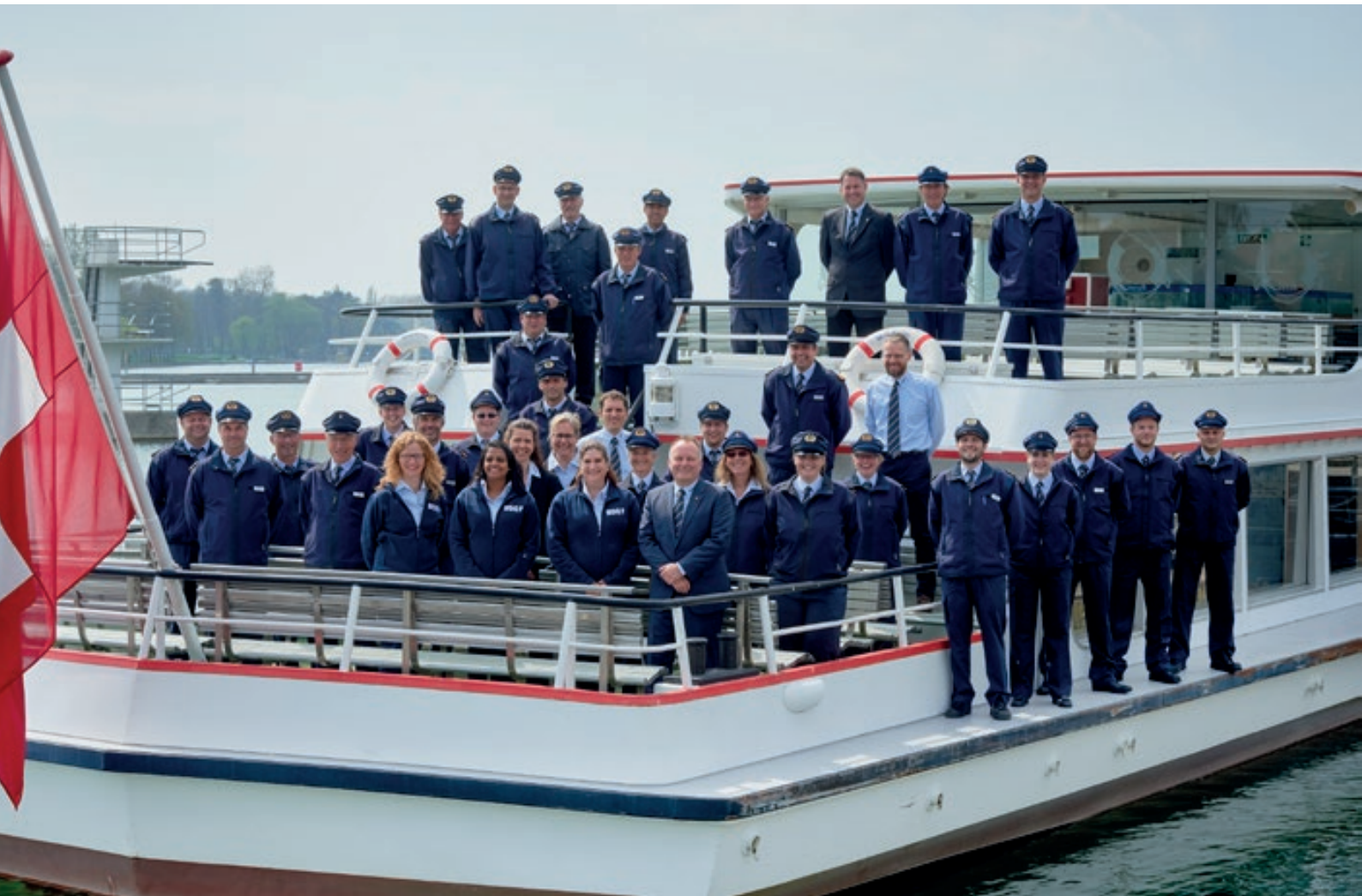
Mitarbeitende der BSG 2016