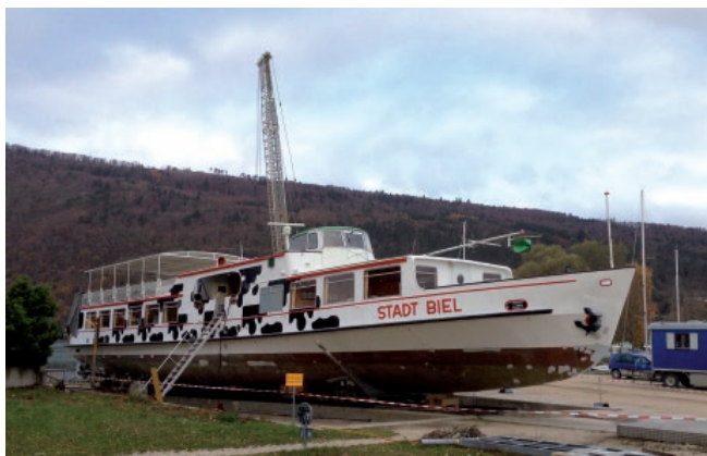
Servicearbeiten MS Stadt Biel

Die Planungsarbeiten für ein neues Steuerpult, welches im Winter 2014/2015 eingebaut wird, wurden abgeschlossen. Im November 2014 ist das komplette Steuerhaus ausgebaut und die Elektrohauptverteilung erneuert worden. Zusätzlich wurden die normalen Servicearbeiten am ältesten Schiff der BSG ausgeführt.