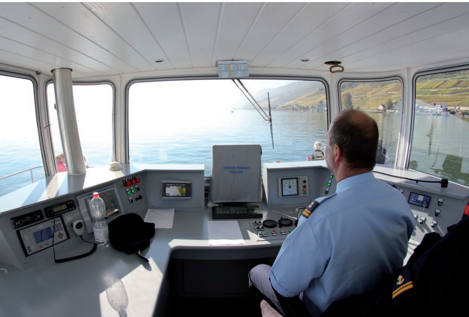
Einblick ins Steuerhaus EMS MobiCat

Folgende Arbeiten sind für die kommende technische Saison geplant: Abdichtung der Stevenrohre bei der MS Petersinsel, Einbau von zwei neuen Generatoren bei der MS Berna, neues Steuerhauspult bei der MS Stadt Biel und Anpassung der Rudersteuerung an die heutigen Vorschriften beim EMS MobiCat.