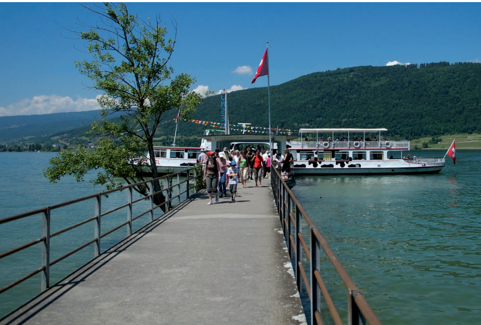
MS Stadt Biel in St. Petersinsel Nord

Für die Zukunft braucht es weitere Massnahmen, um die Einnahmen so breit wie möglich abzustützen. Verwaltungsrat und Geschäftsleitung sind bestrebt neue Wege zu finden, um den nachhaltigen Erfolg zu sichern.