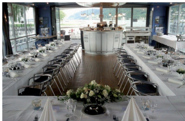
Hochzeitsbankett auf dem MobiCat