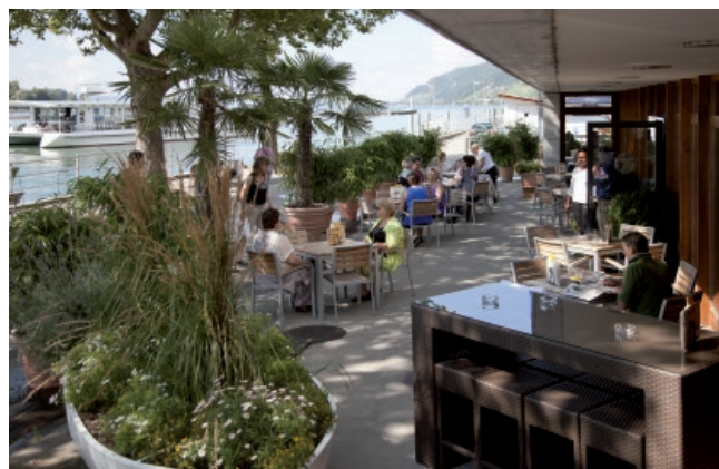
Terrasse Südseite Restaurant Joran