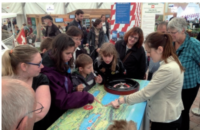
Die BSG an der BEA 2014

In Zusammenarbeit mit der ASM war die BSG zu Gast im Grünen Zentrum anlässlich der BEA 2014 in Bern. Das alte BSG-Schiff MS Jolimont (heute betrieben durch G. Schuppisser) gelangte vom Broyekanal über den Landweg ins Expogelände der BEA 2014 und war ein Höhepunkt der grössten Messe in Bern. In den zehn Tagen der Veranstaltung verteilte die BSG 13'500 Spezial-Broschüren. Mit dem Rücklauf von 5% an verkauften Tickets darf die BSG zufrieden sein.